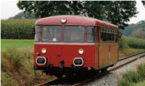
Schienenbus, auch „Roter Brummer“ genannt, wie er auch auf der Allertalstrecke unterwegs war

Habt ihr schon das Foto vom Wietzenbrucher Bahnhof in dieser Zeitung entdeckt? Könnt ihr errahnen, wo der Bahnhof früher war? Wer letztes Jahr bei unserem Geocaching dabei war, weiß noch, wie man mit Kompass & Karte oder einer App auf dem Handy die geografischen Koordinaten 52^{\circ}36'22.3''N und 10^{\circ}1'25.2''E in der Örtlichkeit finden kann.