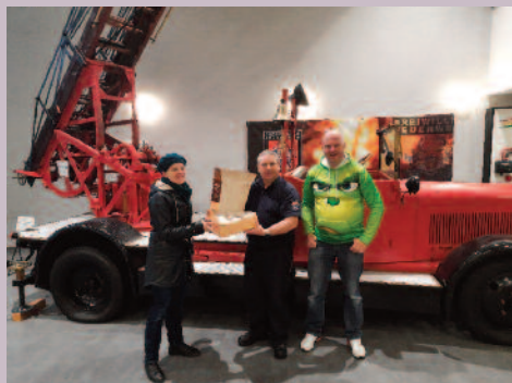
Dank an die Feuerwehr