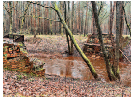
ehemalige Brücke beim Adamsgraben