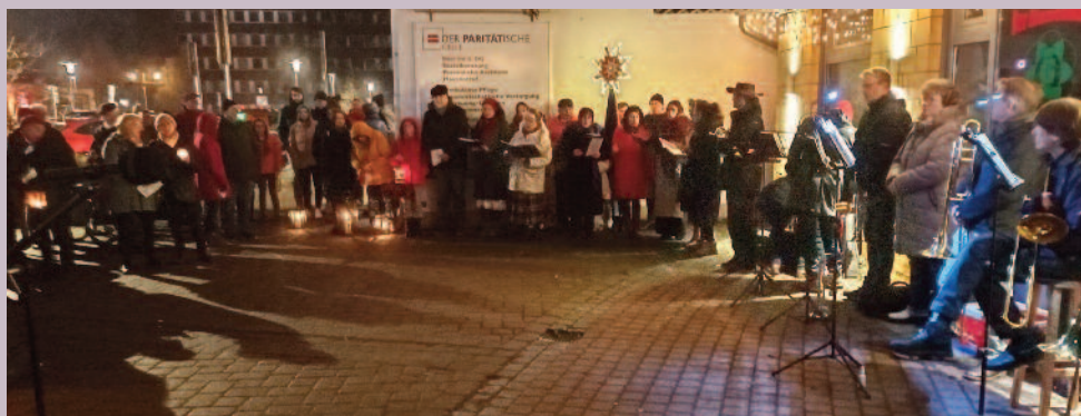
Friedenslicht auf dem Lauensteinplatz