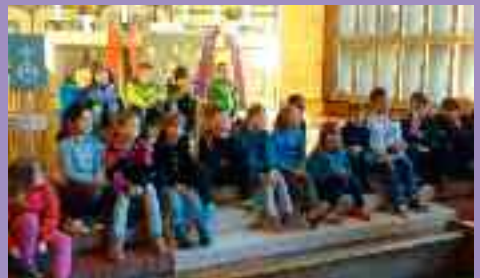
3. Klassen in der Johanneskirche