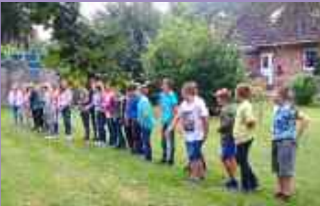
Unsere neuen Konfirmanden/innen