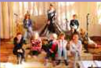
Probe des Jugendchores