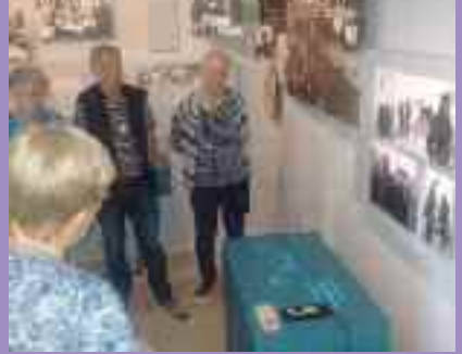
Gemeindefahrt nach Friedland