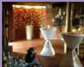
Unter der Empore