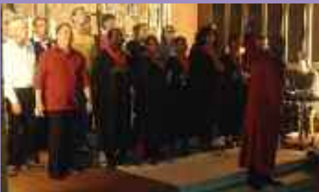
Afrogospel in der Johanneskirche