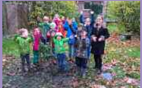
KiGo Kinder und Apfelbaum