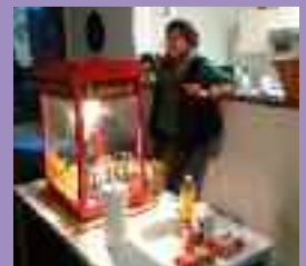
Popcorn für's Kino