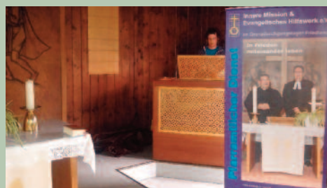
Kapelle im Lager Friedland