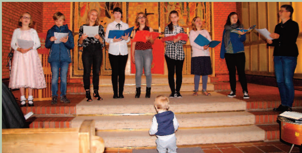
Jugendchor im Taufgottesdienst