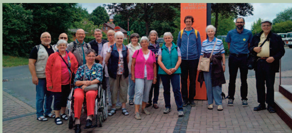
Fahrt nach Friedland