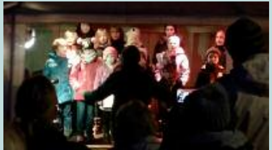
Kinder- und Jugendchor auf dem Wietzenbrucher Weihnachtsmarkt