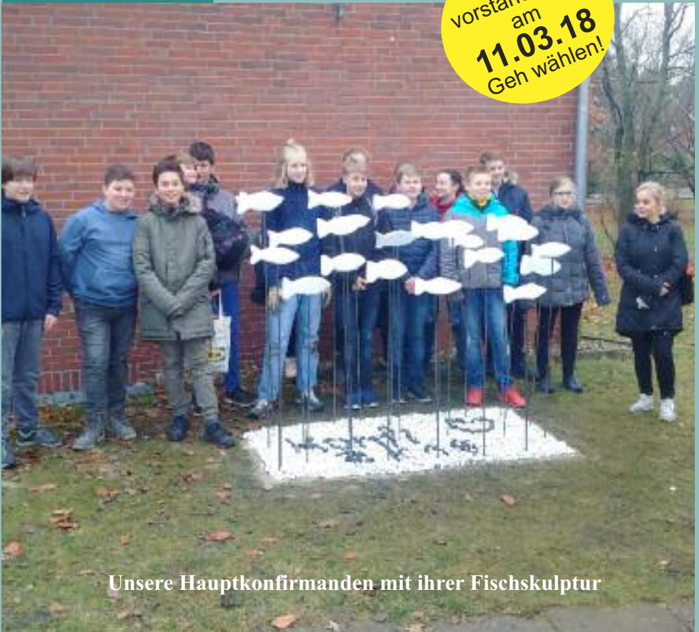
Unsere Hauptkonfirmanden mit ihrer Fischskulptur

Kirchen- vorstandswahl am 11.03.18 Geh wählen!