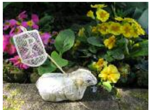
Osterlamm mit Auferstehungsfahne