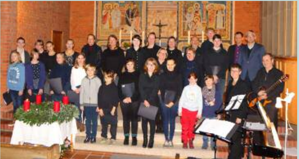
Projektchor beim Quempas-Singen am 1. Advent